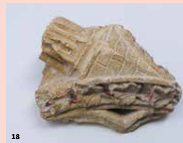
18. Fragments avec traces de polychromie