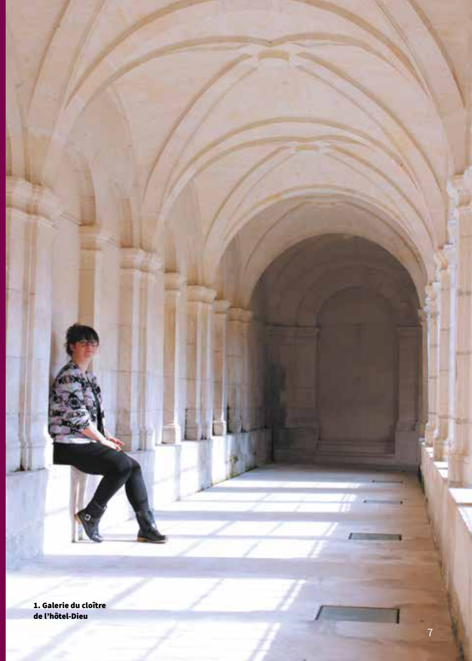
1. Galerie du cloître de l'hôtel-Dieu