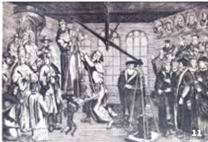
11. Le poids de la Bible, gravure, Musée Jean Calvin